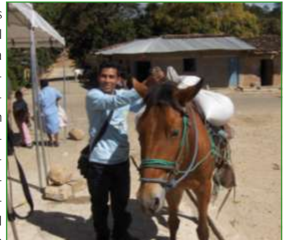
Muchos productores llegan desde sus comunidades a los mercaditos a comprar .

Nos comentaba una productora de Juigalpa que -si no le fuera rentable vender en este mercado campesino, no volvería a llegar-, porque ha tenido buenos ingresos que le ha permitido comprar otros productos que no se produce en su finca, por lo tanto seguirá vendiendo sus cosechas en este lugar.