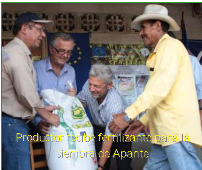
Productor recibe fertilizante para la siembra de Apante