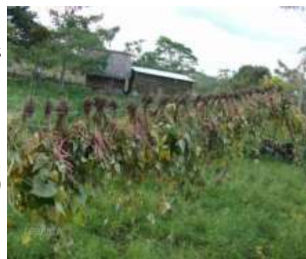
Frijoles en "tendal", en proceso de secado.

A cada familia se benefició con 80 libras de semilla certificada de frijol, insumos, fertilizantes, aves, semillas de arroz y tubérculos.