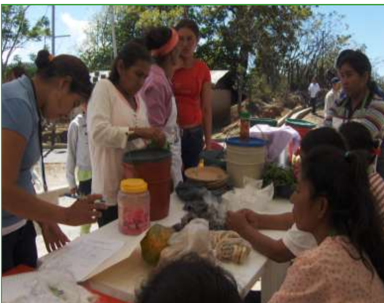
Venta de productos durante la inauguración del mercado de Cusmapa, municipio de Somoto, en el Departamento de Nueva Segovia

mercado municipal, permitiéndoles cubrir dos tipos de demandantes.